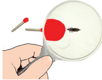
bei Befall mit Kopfläusen oder Nissen